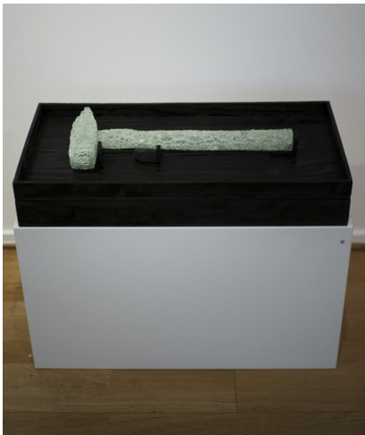
Skulpturen "Tools of Uprising #1" av Kaisa Luukkonen.